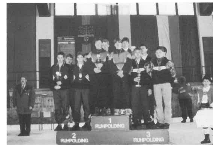
Siegerehrung Mannschaftswettbewerb Jugend v.l.n.r.: TSV Neukirchen, ESC Rattenbach, SC Zwiesel