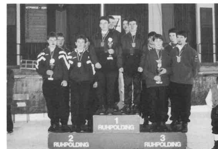
Siegerehrung Mannschaftswettbewerb Junioren v.l.n.r.: EC Saßbach, EC Osterreinen, ESC Rattenbach