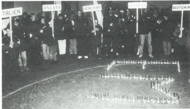
Bei der Eröffnungsfeier formten über 100 Schulkinder der Gemeinde Ritten aus Kerzenlichtern das EM-Symbol.